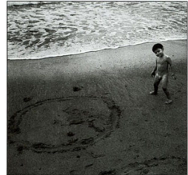
Golfo de Baratti, 1997 . Impresión en Epson Stylus Pro 10000, 74.3 x 88.2 cm.

Y es justamente sobre el paisaje recortado que trabaja el fotógrafo italiano Nicola Lorusso. Él sí aparentemente respetando las “limitaciones” esenciales de la fotografía en tanto tiempo congelado, captura instantánea. Si bien, trabajar su última serie bajo el encabezado Diario del mar denota una cierta intención de continuidad, de narrativa,