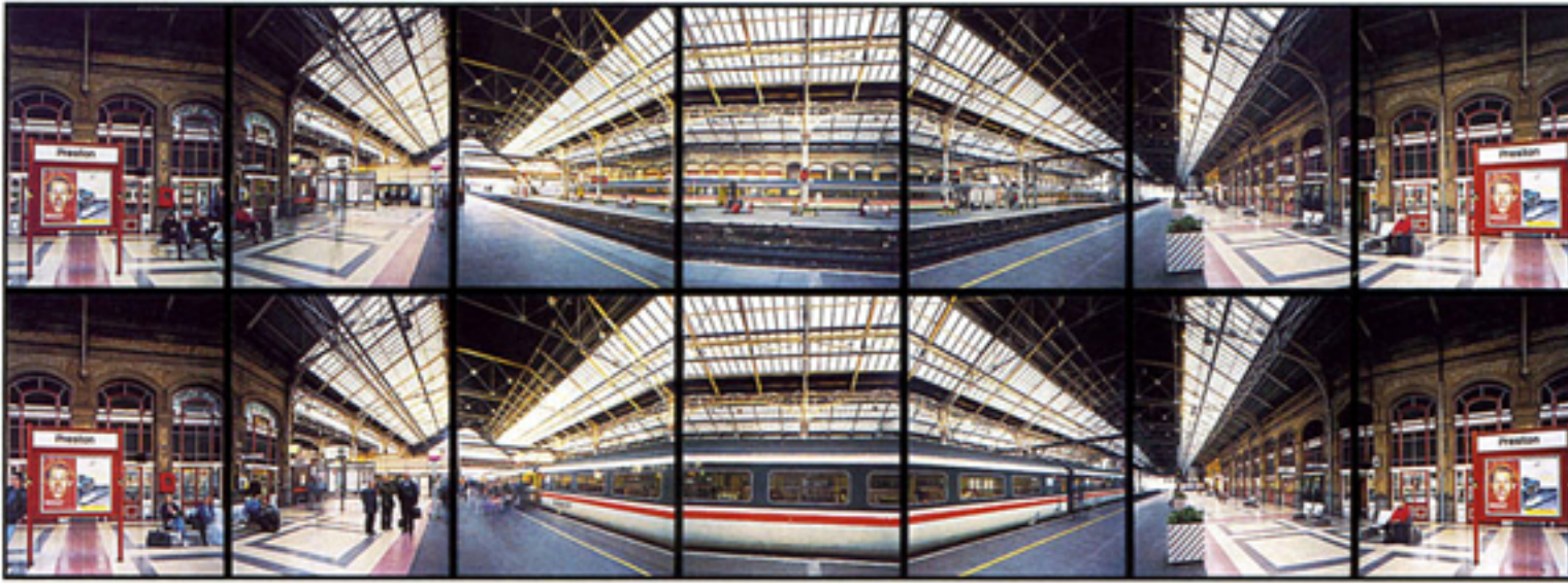
Robert Richfield, Preston Station, Lancashire, England, 1997 . Impresión a color, 60 x 192.5 cm; 14 paneles verticales de 35 x 27.5 cm, 2 hileras de 7.

de lectura en recorrido. De una manera distinta a Richfield, pareciera aun que ambos tratan de acompañar el disparo de la foto sola y accionarlo dentro de lecturas un poquito más extensas: series, paneles, fotoensayos.