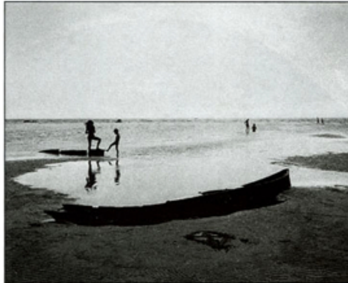
Follonico, Italia, 1998 . Impresión en Epson, 88.2 x 106.2 cm.

Se habla de la mirada cinematográfica en la fotografía como efecto desdoblado de la imagen en movimiento, es decir: el cine. Es interesante observar el juego que esta mirada con ansia por desplazarse acciona en muchos artistas contemporáneos de la lente. Uno de los más interesantes entre ellos, el inglés Robert Richfield, hace de los juegos de recorrido fragmentado, posibilidad de recreación de desplazamiento de la mirada desde el cuerpo que gira sobre un punto fijo. Así, en secuencia de tomas cuelga sobre el muro sus recorridos visuales sobre arquitecturas industriales inglesas, campiñas y parques neoclásicos, cementerios franceses, estaciones de tren y viejos parques de diversiones. Así que la captura de espacios exteriores en 360°, impresos en